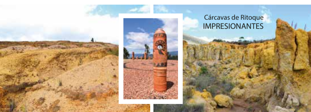
Cárcavas de Ritoque IMPRESIONANTES

Vívelo con guías profesionales, recrea la vista entre plantas de cactus, paisajes multicolores y una estructura de roca fascinante. Descubre los matices del Desierto de la Candelaria y llega al Patio de las Brujas un observatorio solar con iconografía de la cultura Muisca, un lugar misterioso cargado de tradición oral.